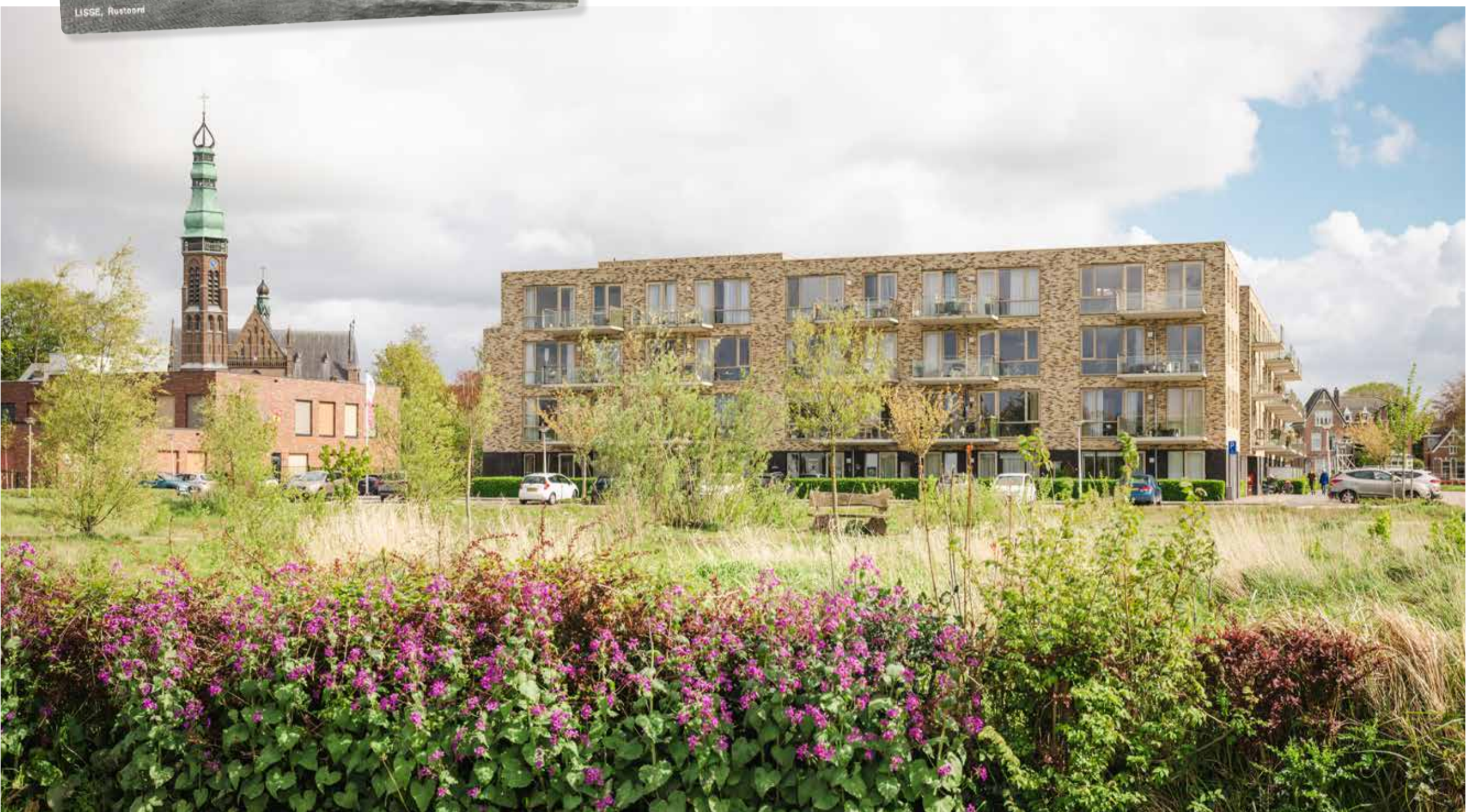
Linksboven: Rustoord, periode: 1960 - 1979. Boven: Locatie Rustoord in Lisse anno 2024